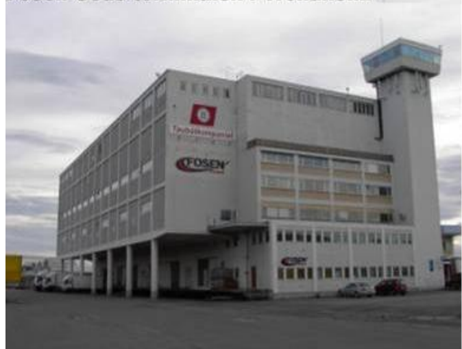
Fosen Gods terminalen i Trondheim

Brattøra, Kai 9, Pir II, 7010 Trondheim Areal 600m2 kontor + 4200 m2 lager. Man-Fre: 08:00-16:00