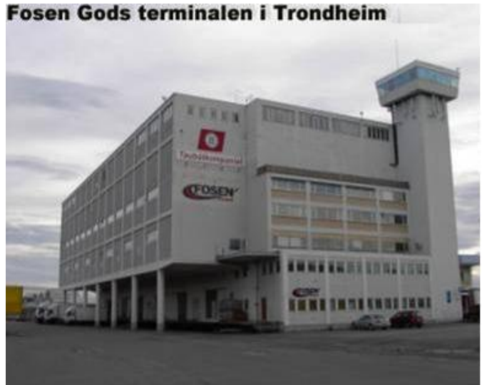
Fosen Gods terminalen i Trondheim

Brattøra, Kai 9, Pir II, 7010 Trondheim Areal 600m2 kontor + 4200 m2 lager. Man-Fre: 08:00-16:00