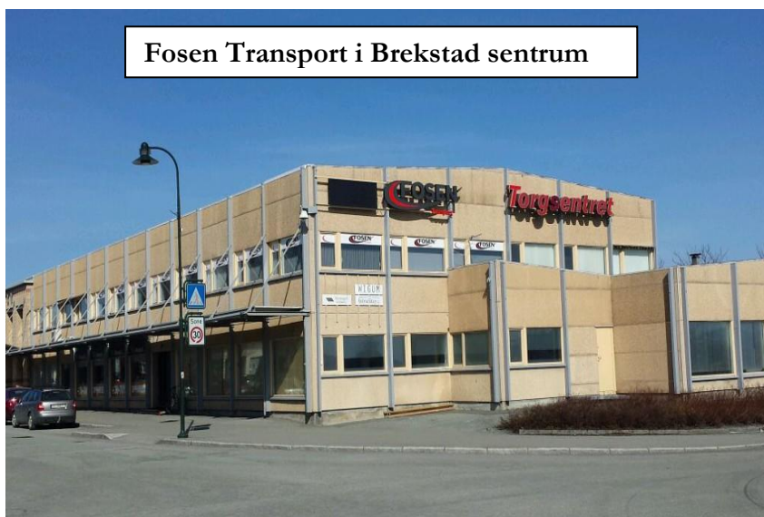
Fosen Transport i Brekstad sentrum