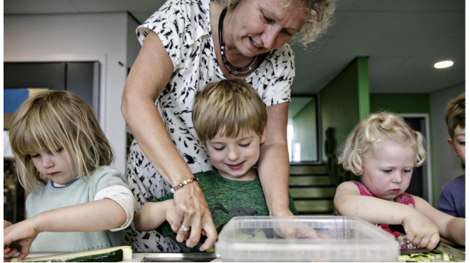
In-og eksklusiverende læringsfællesskab