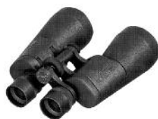
KIKKERT (PORROPRISMER) OPTOLYTH ALPIN 10X50 NG-BGA