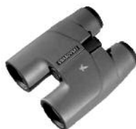
KIKKERT (TAKKANTPRISMER) SWAROVSKI SLC 10X42