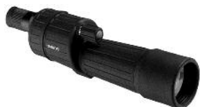
TELESKOP M/PORROPRISMER OPTICRON HR 60 SR