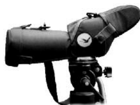
TELESKOP M/PORROPRISMER OG STAY ON-VESKE KOWA TS-611 (45° OKULAR-PLASSERING)