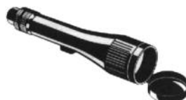
TELESKOP M/TAKKANTPRISMER BAUSCH & LOMB ELITE 60 MM

Her forklarer vi de viktigste optiske og mekaniske begreper som brukes for å beskrive kikkerter og teleskop. Opplistingen er gjort i den rekkefølge begrepene opptrer i våre tester.