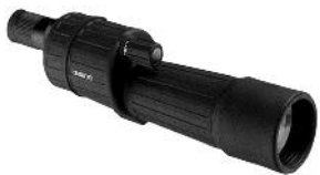
TELESKOP M/PORROPRISMER OPTICRON HR 60 SR